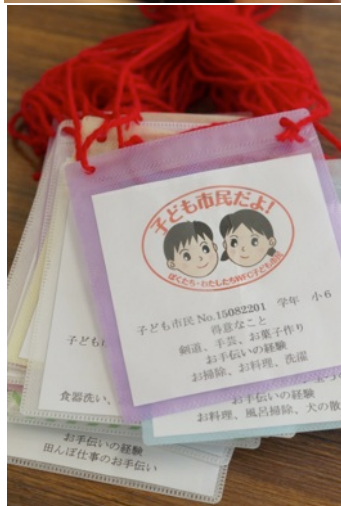
市民証には名前はなく、自分の特技やお手伝いの経験がかかっている。マルシェ店長との会話で名前などの自己紹介をする。