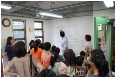
ハローワーク職員より仕事の説明