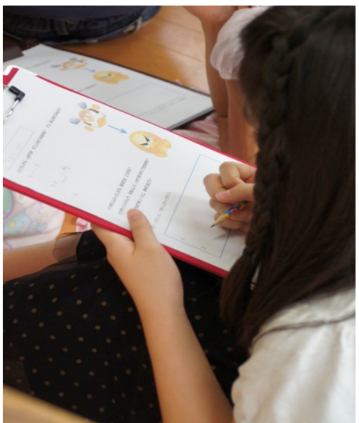
カッとなった時 6 秒間どうやって気を紛らわす？ 回答シートのそれぞれの対応方法を記入