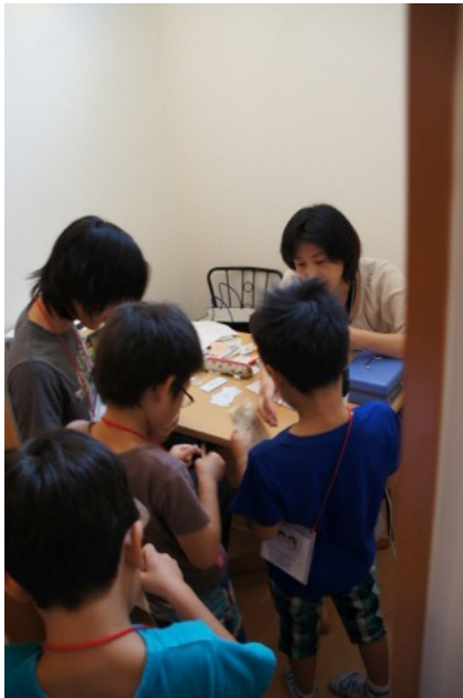
銀行での納税する子ども市民。