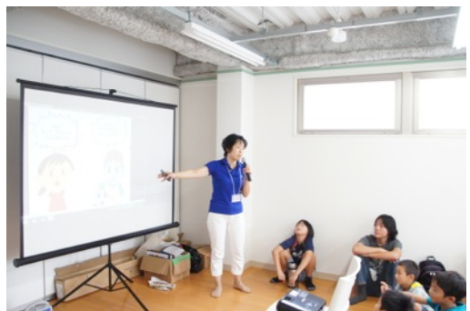
コミュニケーションについての学び（しあわせ子育て ノブリの森 森講師）